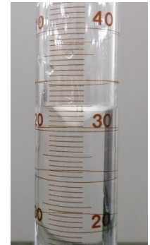
1mL設定(10分経過) 5mL設定(5分経過) 9mL設定(5分経過)