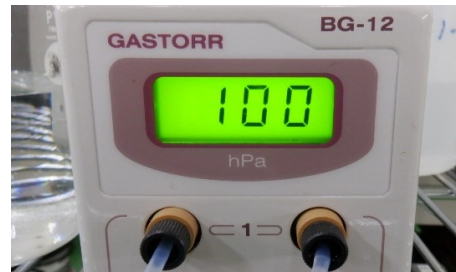
溶媒脱気装置稼働時表示(100hPaに設定され)